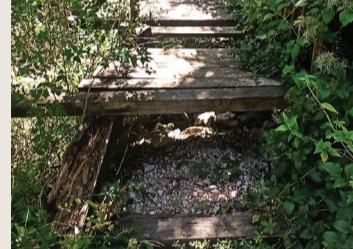
Разбито мостче в м. „Чешмата“

това води и до непрекъснати нови и нови желания на другите жители на селото.