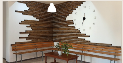
Новото пано във фойето на кметството