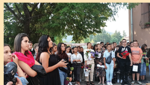
Започва учебната 2023/2024 г. в Професионална гимназия „Н. Вапцаров“