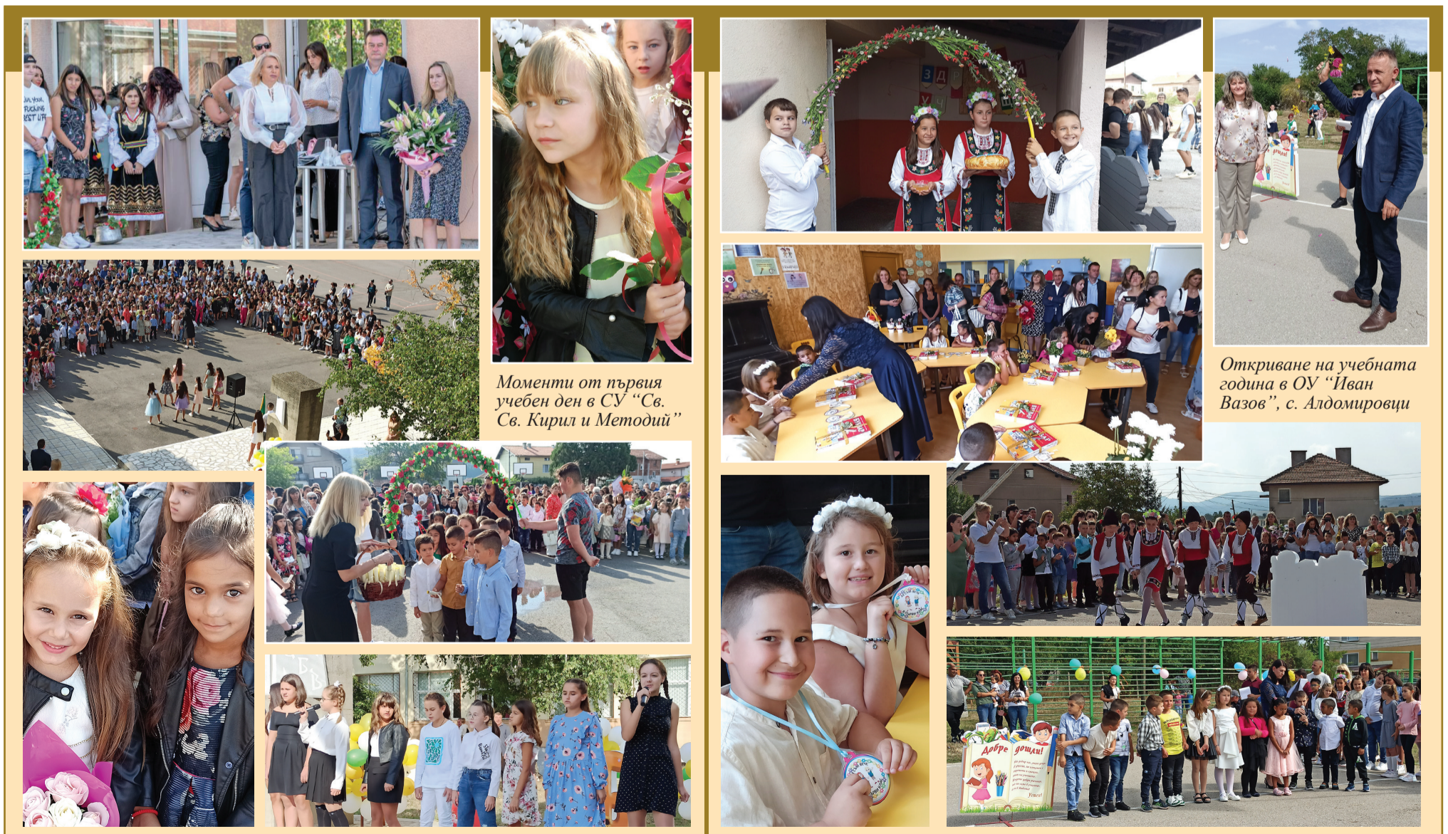
Моменти от първия учебен ден в СУ "Св. Св. Кирил и Методий"